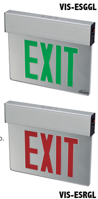
MONTAJE POR UN EXTREMO