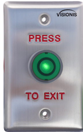
Con Luz Encendida