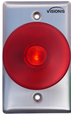
Con Luz Encendida