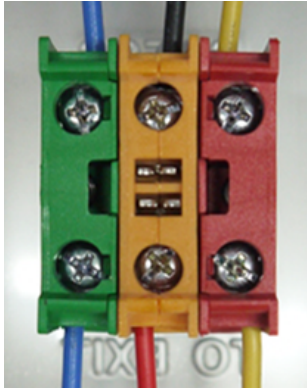
Diagrama de Cableado Botón Presionar para Salir