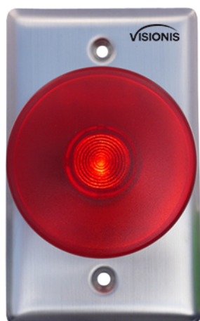
Con Luz Encendida