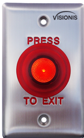
Con Luz Encendida