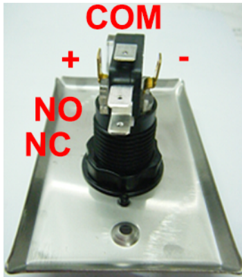
Diagrama del Cableado

Color del Cable + : Rojo - : Negro COM : Verde N.O : Blanco N.C : Anaranjado